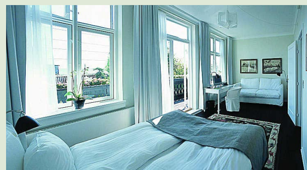
Delikat. Alle rommene er pusset opp i en enkel og lys skandinavisk stil med hvite møbler og moderne billedkunst.