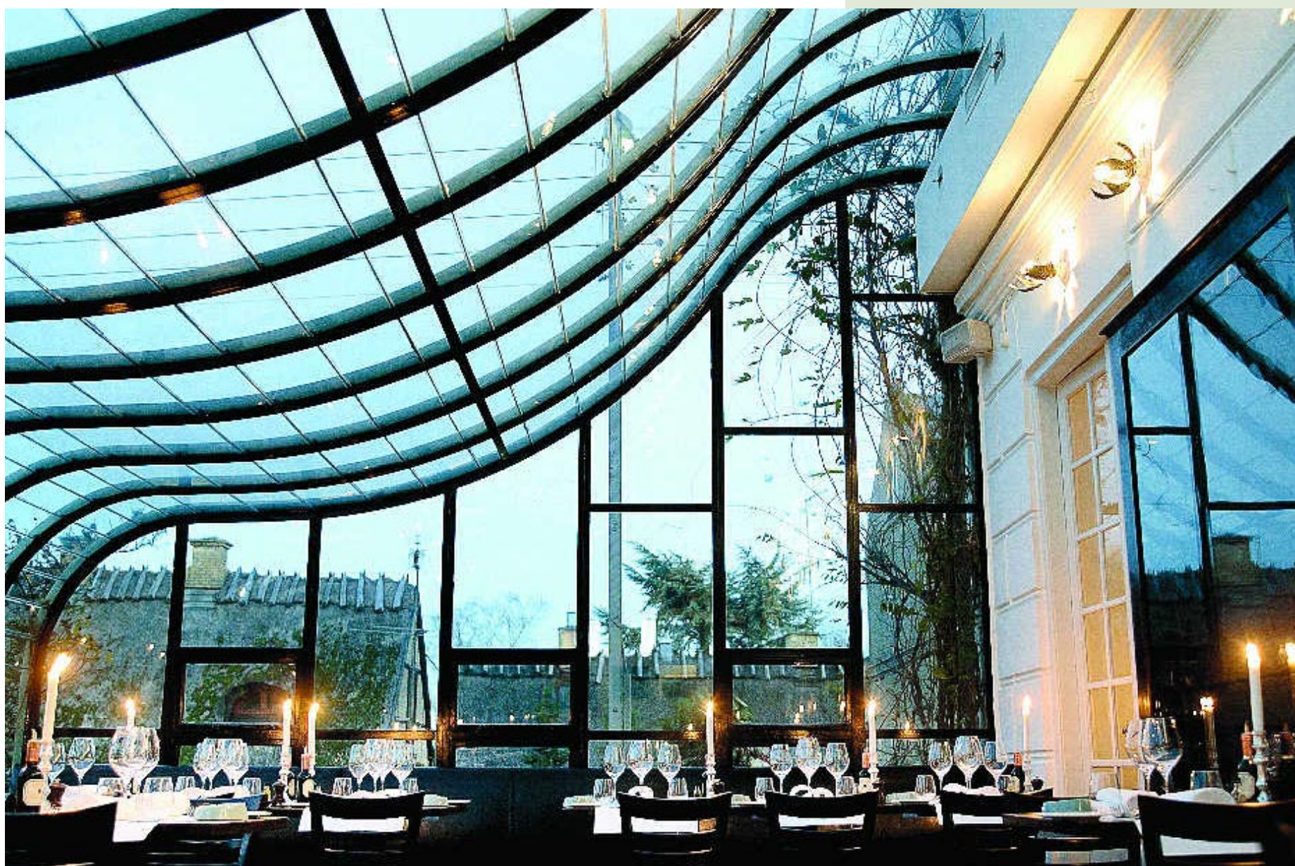
I vinterhagen. Halvparten av restaurantbordene på Skovshoved Hotel ligger i den gamle vinterhagen.